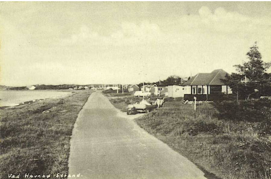
Ved Havnsø Strand